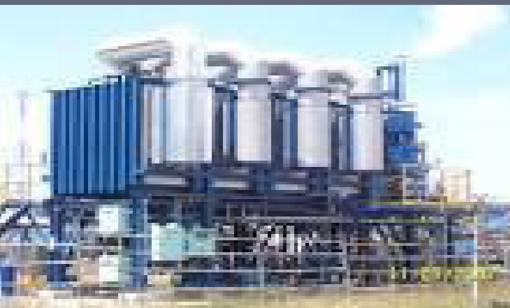
Power Plant (Industrial)

Straightening, Re-building, Machining, Line Boring, Welding, Grinding, Honing and Hard Chrome Plating, Hydro-testing, Hardness Testing, and Wear Resistance, Surface Finishing, Alignment Check.