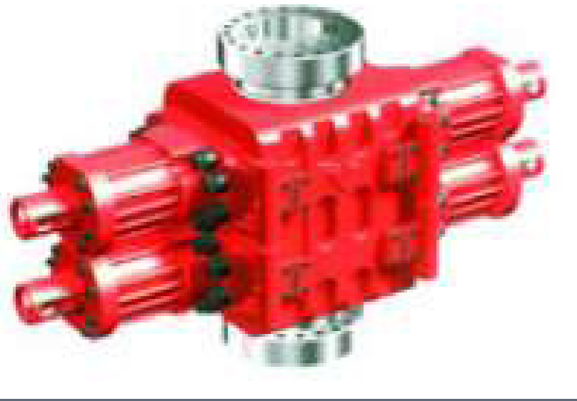
BOP (Oil & Gas)

Untuk industri Perminyakan & Gas, Kami melakukan :